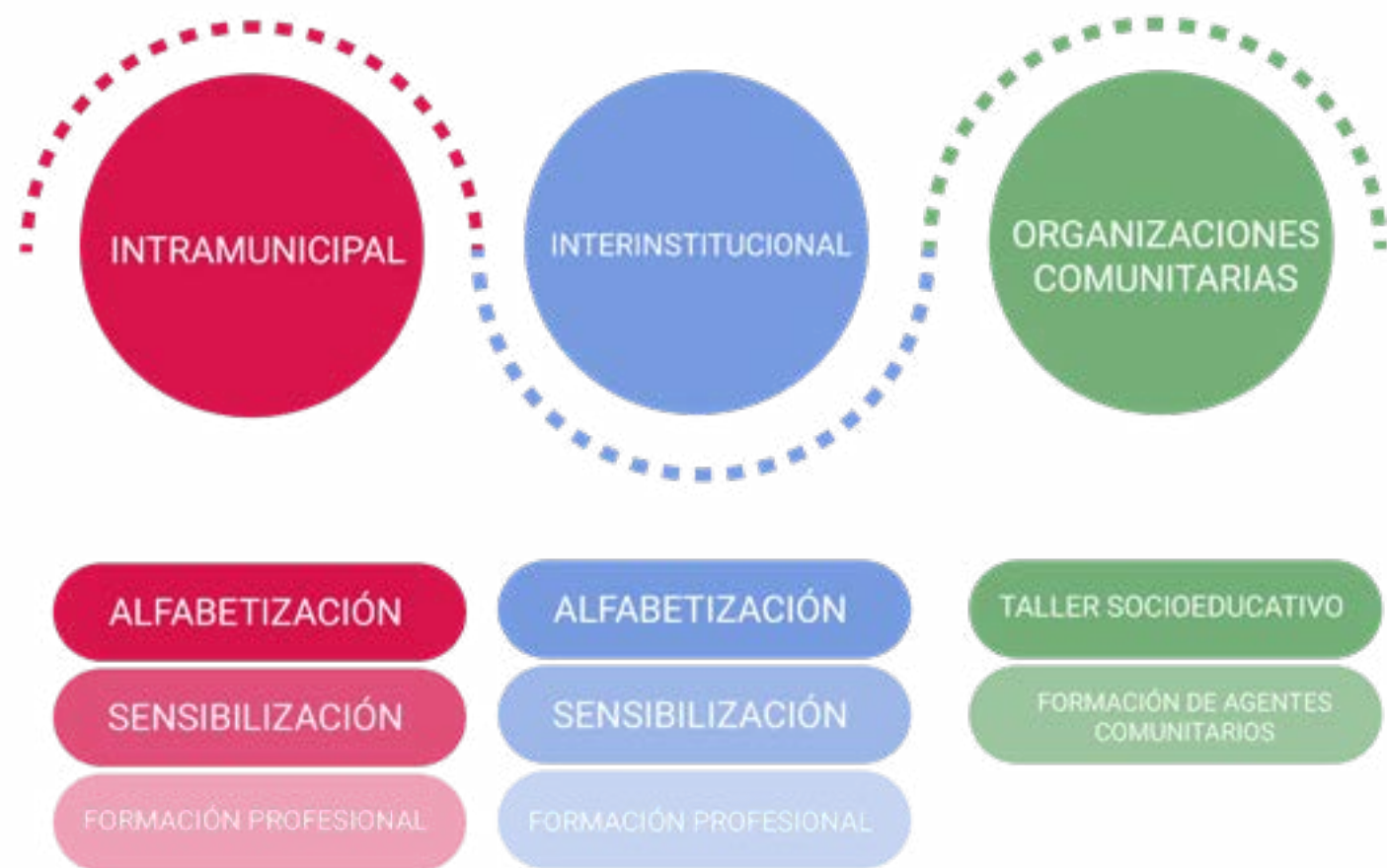
Esquema 2. Intervención

Todas estas líneas se relacionan con la oferta programática que llevan adelante los departamentos de la Dirección de Género: Mujeres y Diversidades, así como con los programas colaborativos del SernamEG.