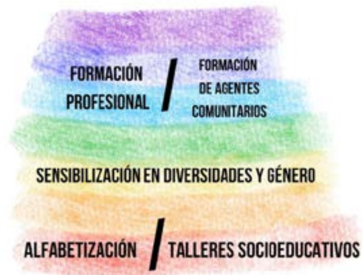
Esquema 3: Pirámide de complejidad de intervención